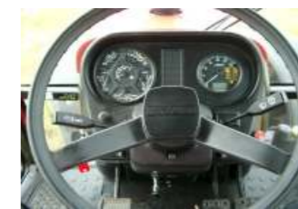
Alle Funktionen im Blick