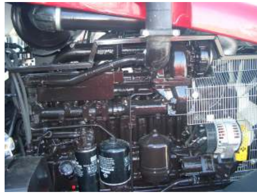
MTS 1523.4 mit 158 PS