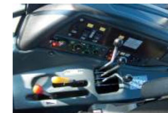
MTS 1523.4 oder 2022.4 EHR, Steuerblock mit 3 Einheiten Hohe Zapfwellenleistung