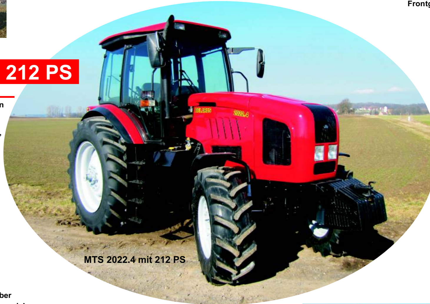
MTS 2022.4 mit 212 PS

Motorsteuerung über elektronisches Gaspedal