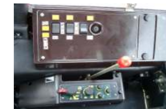
MTS 1221.4 EHR, elektrohydraulische Bedienung von Zapfwelle, Allrad und Differentialsperre