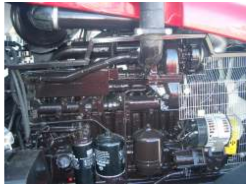
MTS 1523.4 mit 158 PS