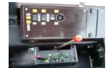
MTS 1221.4 EHR, elektrohydraulische Bedienung von Zapfwelle, Allrad und Differentialsperre