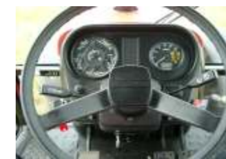
Alle Funktionen im Blick