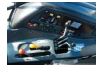
MTS 1523.4 oder 2022.4 EHR, Steuerblock mit 3 Einheiten Hohe Zapfwellenleistung